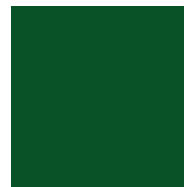
RAL 6005 Moosgrün